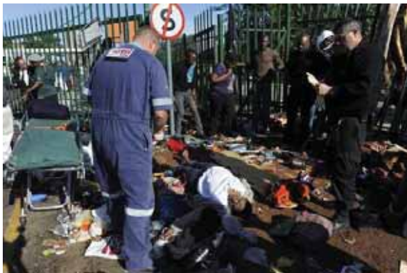
یک مادر: کشته نابرابری آموزشی

آموزش در همه‌جا پهن است، نابرابری آموزشی حکم‌فرماست. از سال ۱۹۸۵ شهریه‌های دانشگاهی به میزان ۵۵۹ درصد افزایش داشته‌اند. بنابراین، هر سال گروه بزرگی از داوطلبان تحصیل در آموزش عالی به علت گرانی آموزش، از تحصیل باز می‌مانند. بنا به تخمین‌های سازمان ملل، اکنون در جهان حدود ۵۷ میلیون کودک از آموزش در دوره ابتدایی محروم‌اند و برای اینکه تا سال ۲۰۱۵ این کمبود جهانی جبران شود، باید حداقل ۱/۶ میلیون معلم تربیت شوند. این رقم برای سال ۲۰۳۰ حدود ۳/۳