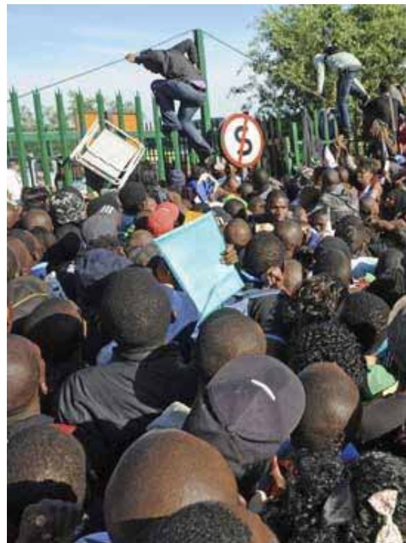
دانش آموزان و والدین فقیر آن ها برای نام نویسی در دانشگاه زوهانسورک جمع شده اند.

وقتی درها باز شد، بر اثر هجوم مردم ۲۰ نفر زخمی شدند و یک مادر که آمده بود زندگی بهتری برای پسرش به دست آورد، کشته شد